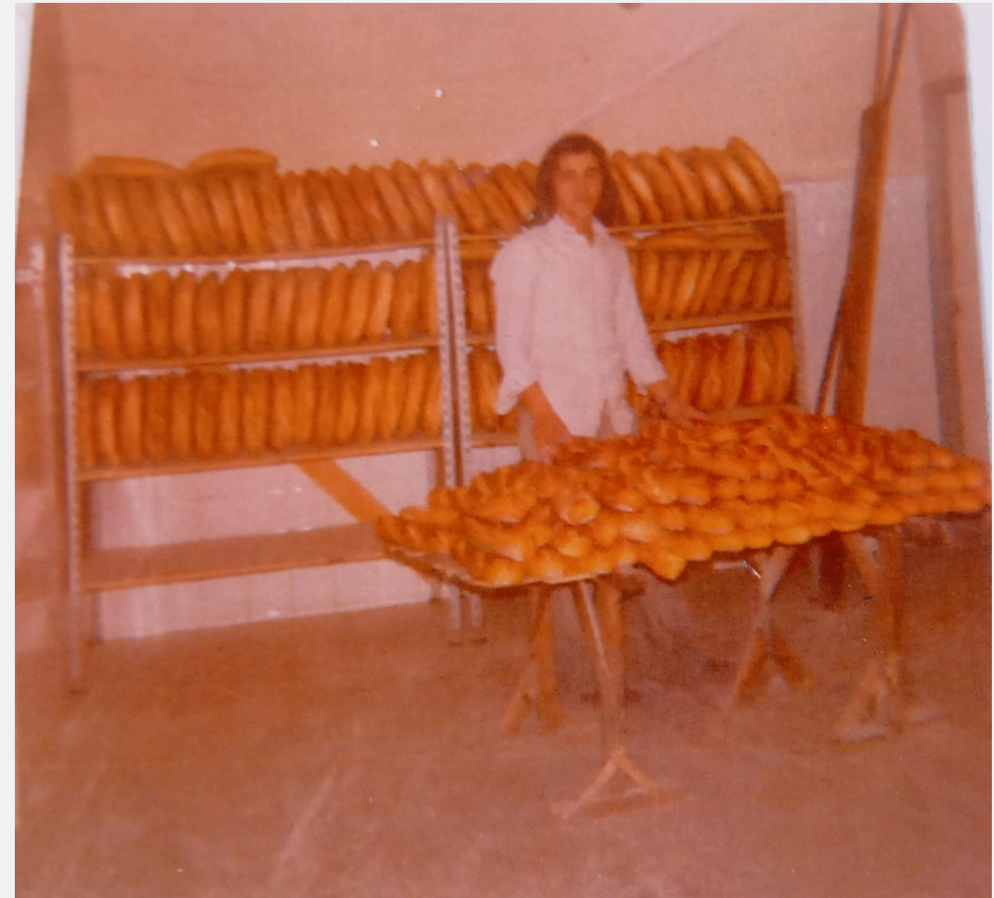
En esta foto, aparece mi abuelo con varias hornadas de pan. La mayoría de los panes que se ven, son hogazas de 1kg.