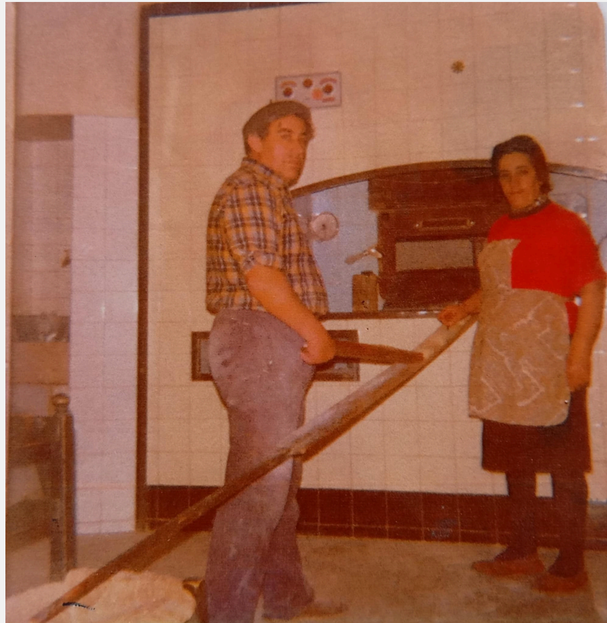
En esta foto podemos ver a mis bisabuelos metiendo barras de pan en el horno de leña. Están utilizando una pala especial para las barras, llamada “palín”.